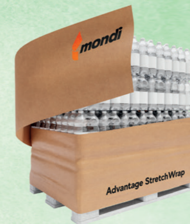
MONDI Advantage StretchWrap