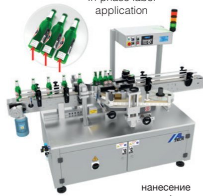
нанесение этикетки в фазе

этикетки на изделия различной формы, изготовленная с использованием самых надежных материалов и компонентов, доступных на рынке, что обеспечивает превосходные эксплуатационные характеристики и производство. Модульная конструкция объединяет головки ALstep и/или ALritma и может быть сконфигурирована в соответствии с потребностями заказчика, позволяя наносить этикетку любой формы и размера опоясывающую, с лицевой/обратной стороны и запечатывание пищевых, косметических, химических и фармацевтических продуктов. Дополнительная информация: info@altech.it - www.altech.it