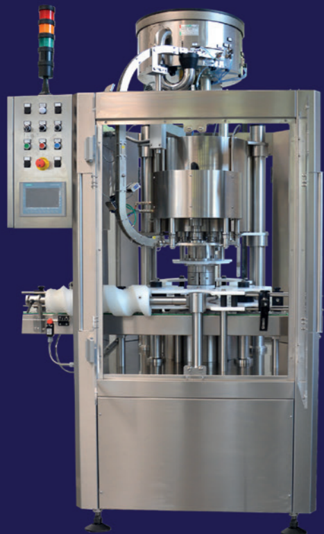
AUTOMATIC Capping Machine Mod. SIRIO (Pick & Place)