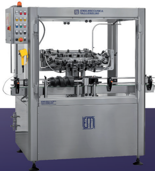
AUTOMATIC Rinser Machine Mod. DOLPHIN

Deep-rooted in tradition, projected into the future